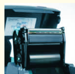
Mecanismo sólido y estable con fiabilidad a largo plazo