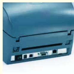
Puerto USB 2.0 de serie y USB 2.0 en paralelo