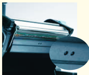
Doble sensor que le permite utilizar una amplia gama de etiquetas